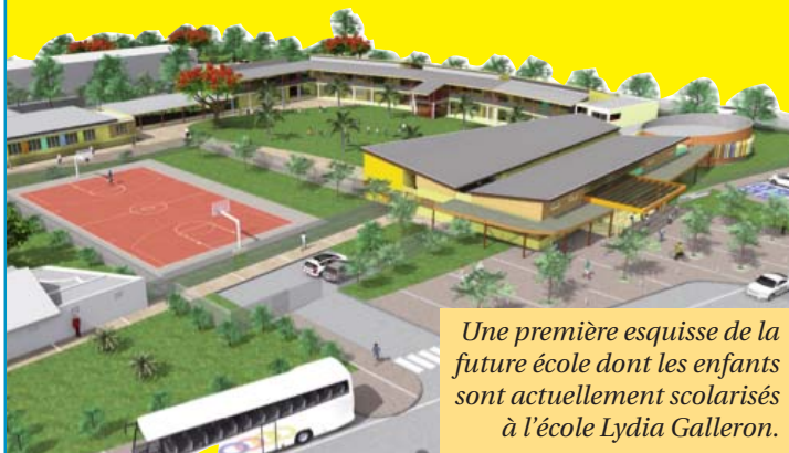
Une première esquisse de la future école dont les enfants sont actuellement scolarisés à l'école Lydia Galleron.