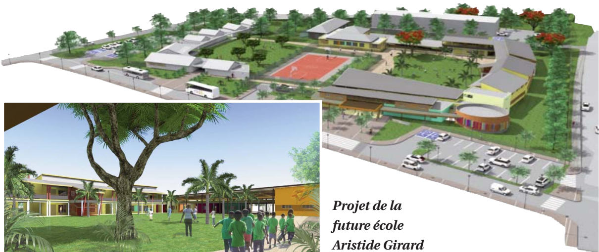
Projet de la future école Aristide Girard