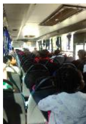
Dans le bus

Mardi 29 Mars 2016 , nous sommes en sortie à la plage de Bois Jolan à Sainte-Anne avec un effectif de 50 enfants et de 16 animateurs. L'effectif du groupe « des grands » est de 15 enfants ce jour. Déroulement de la journée en images.