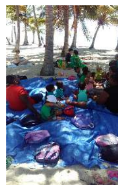
« Comptines pour les petits »