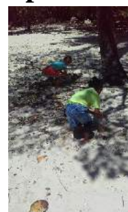
« Course de remplissage de bouteilles d'eau » avec « les grands »