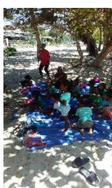
« Danse La Samba » avec « les moyens »