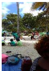
jeux libres surveillés sur le sable