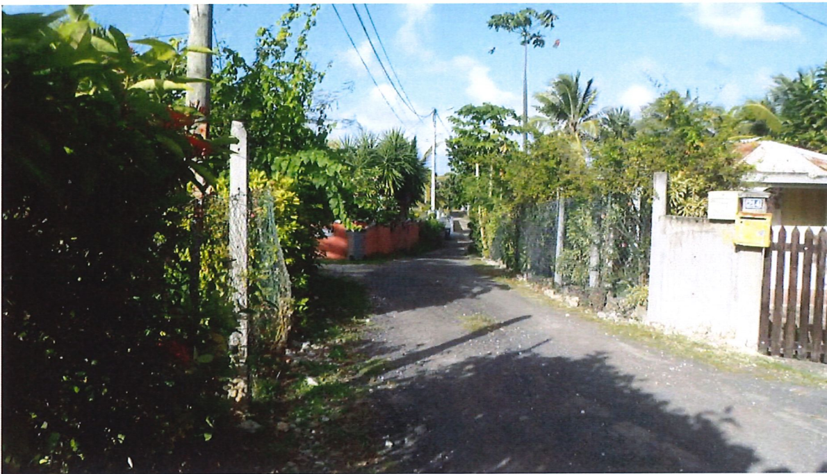
Figure 2 : voie de desserte du secteur