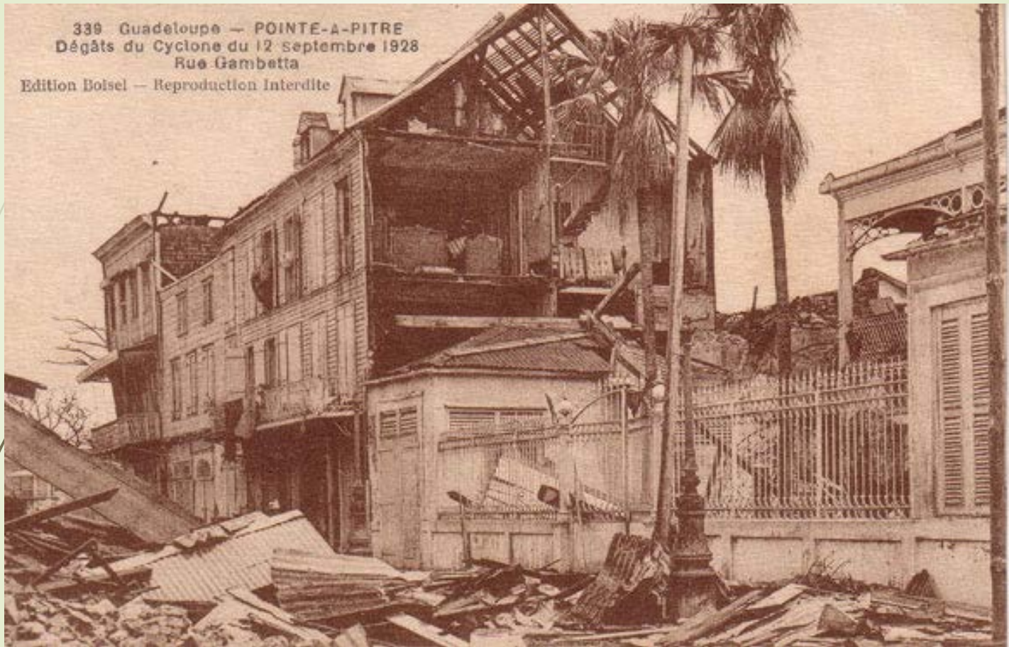
339 Guadeloupe — POINTE-A-PITRE Dégâts du Cyclone du 12 septembre 1928 Rue Gambetta Edition Botsel — Reproduction Interdite